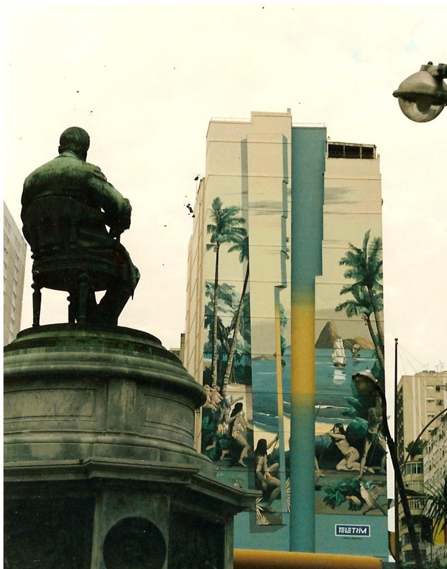
O monumento de José de Alencar, na praça que leva o nome do escritor, zona sul do Rio de Janeiro. À sua frente, uma paisagem com índios, caravelas e palmeiras, tendo ao fundo a Baía de Guanabara. Este gigantesco painel foi pintado na lateral do Edifício Juruá, na Rua Barão do Flamengo.